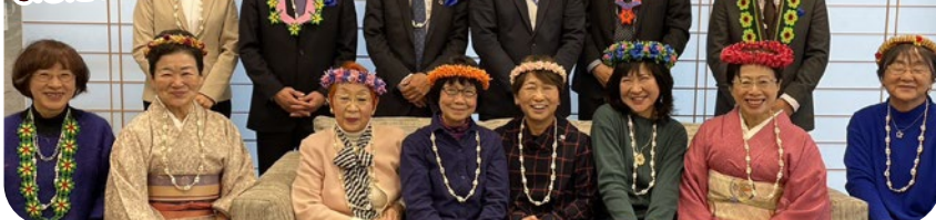
ミクロネシア連邦大使館へ 訪問させていただきました!