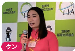
タン ★ベトナム 自然を 守ってほしい