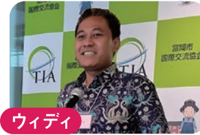
ウィディ ★インドネシア インドネシアの こと