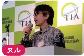
ヌル ★インドネシア 仕事の経験

富岡市周辺に住む 日本語を学んでいる 外国人のみなさんが 日本語でスピーチに 挑戦しました!