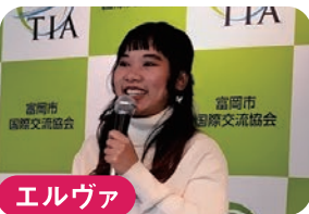
エルヴァ ★インドネシア 新しい 電動自転車