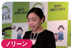
ノリーン ★フィリピン だれだったのか