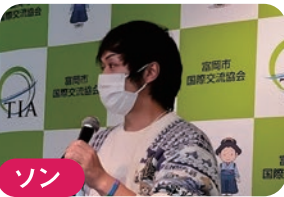
ソン ★中国 虹色