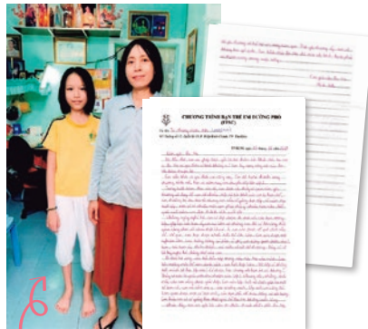
アンちゃん《中学1年生》