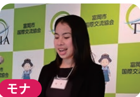
モナ ★フィリピン 日本で学んだ 人生を変える教訓