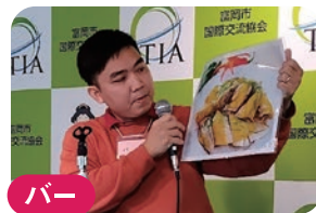
パー ★ベトナム 茹で鶏! 大好きな料理