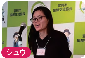
シュウ ★中国 うちの猫