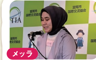
メツラ ★インドネシア ごみの分別