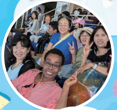
水族館 おもしろい!!

アクアワールド茨城大洗水族館へ！ イルカのショーでは大きなジャンプに大興奮！ 海鮮市場で生ガキに挑戦したり、バスの中で盛り上がり、 楽しい1日でした！