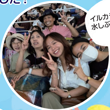
イルカショー 水しぶきすごい!!