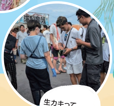
生ガキって おいしいのかなあ