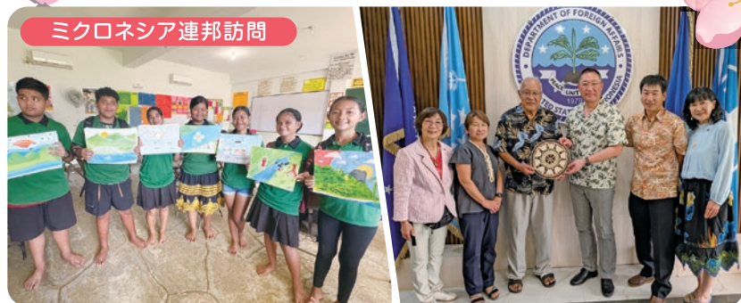
ミクロネシア連邦訪問

令和6年度は4年ぶりに国際交流研修旅行を開催することができました。大阪で行われる万博でのミクロネシア連邦との交流プログラムも進んでいます。6月1日の国際交流まつりも楽しみにしてください!