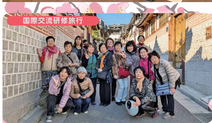
国際交流研修旅行

令和6年度は4年ぶりに国際交流研修旅行を開催することができました。大阪で行われる万博でのミクロネシア連邦との交流プログラムも進んでいます。6月1日の国際交流まつりも楽しみにしてください!